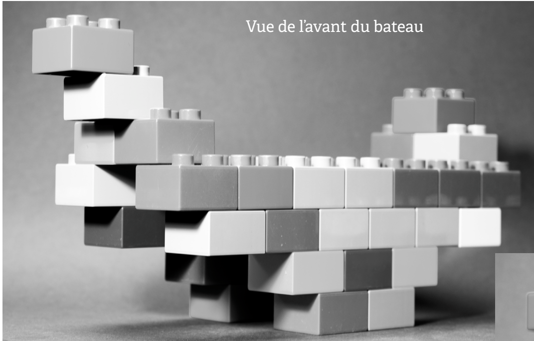
Vue de l'avant du bateau